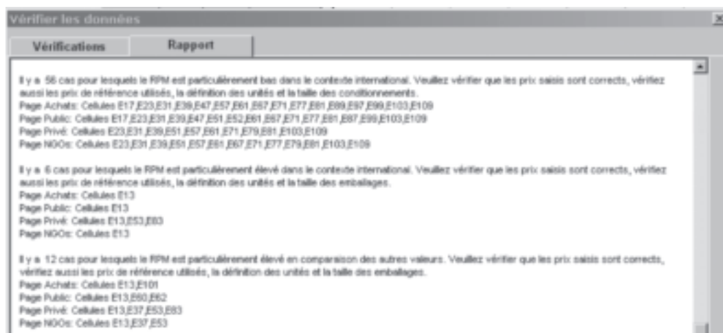
Figure 7.9 Exemple de résultats obtenus en utilisant le vérificateur de données

vérifiées et la raison pour laquelle cette information a été signalée (voir exemple à la Figure 7.9).